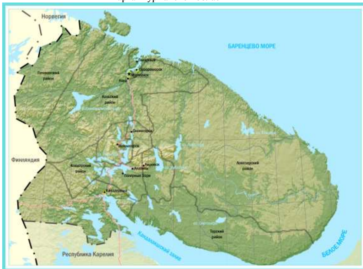
Карта Мурманской области

На юге Мурманская область граничит с Карелией, на западе – с Финляндией, на северо-западе – с Норвегией.