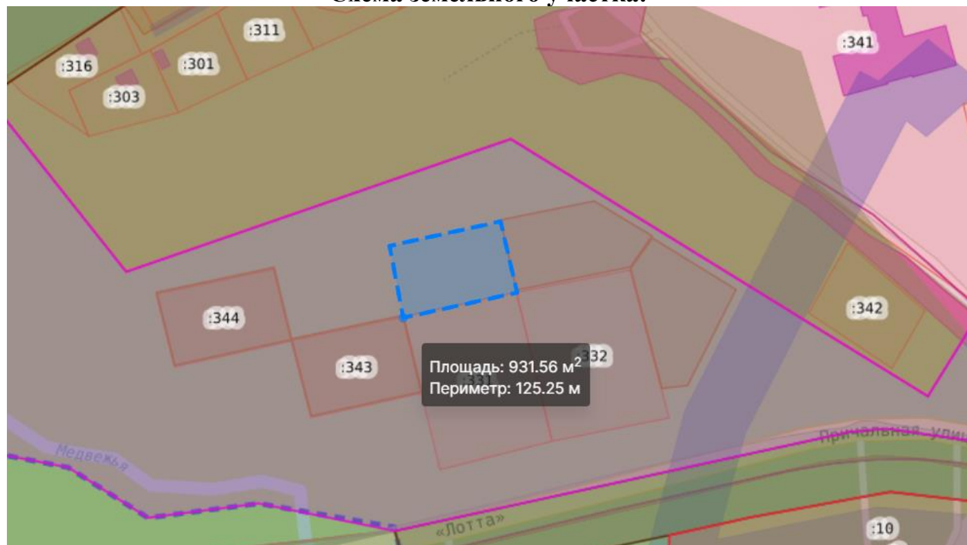
Схема земельного участка: