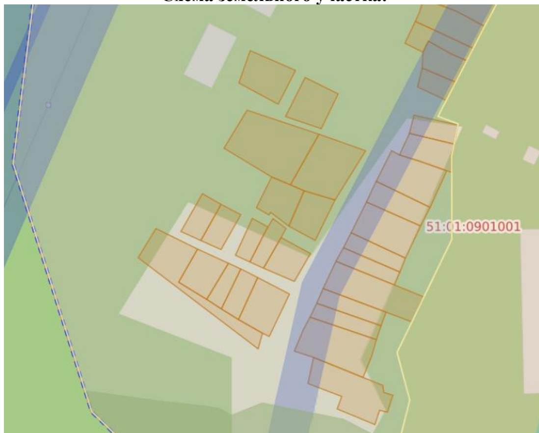
Схема земельного участка: