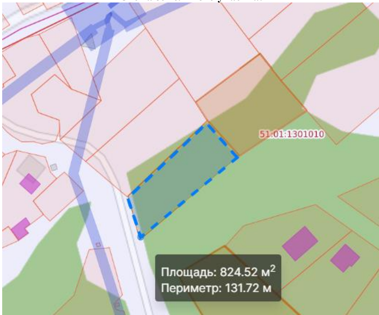
Схема земельного участка: